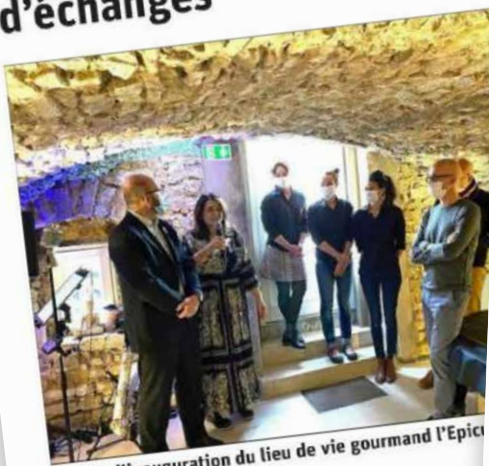
Lors de l'inauguration du lieu de vie gourmand l'Epicurie à Vroncourt.

Vroncourt vient d'inaugurer l'Epicurie, espace multiservices qui se veut consommateur.