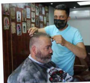
Yoann allait régulièrement à Nancy, où exerçait Yilmaz.

« Dombasle est en plein essor et ces nouveaux commerces redynamisent le tissu local » Yoann Un client